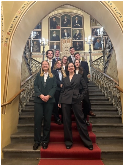
Pre-Moot in Riga