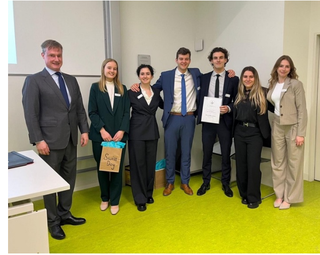
Swiss Day an der Fakultät