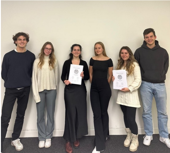
Abgabe zweiter Schriftsatz