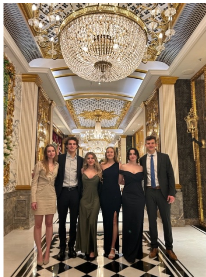
Opening Ceremony in Hong Kong