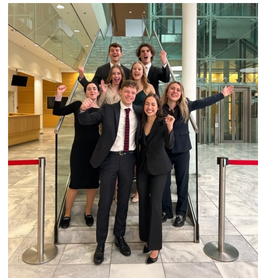
Closing Ceremony in Wien