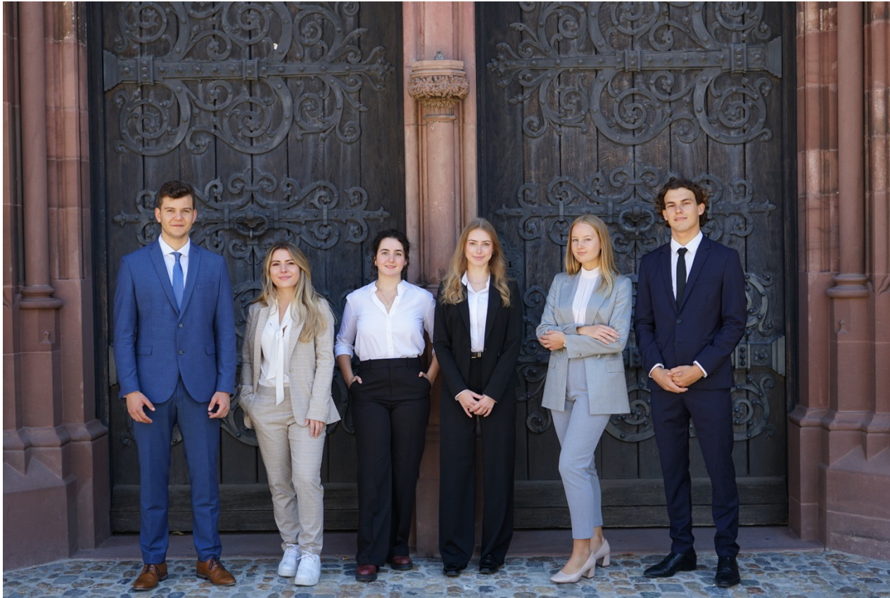
The Team 2023/2024